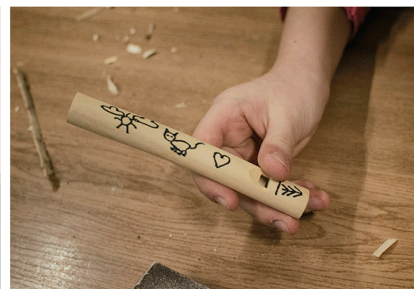
6. GOTOWY INSTRUMENT

Koszt warsztatów ustalany jest indywidualnie i uzależniony jest od ilości uczestników oraz lokalizacji (koszty transportu). Za przeprowadzone zajęcia wystawiamy rachunek bądź podpisujemy z organizatorem odpowiednią umowę cywilno – prawną.