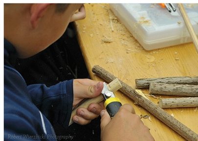
4. WYCINANIE OTWORU WARGOWEGO