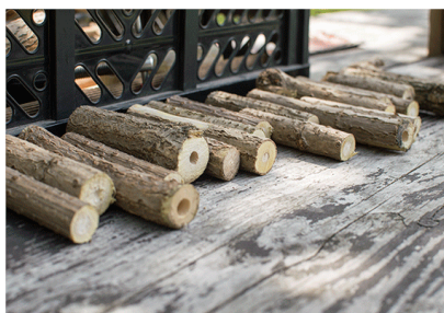
1. CZARNY BEZ POCIĘTY NA ODCINKI I GOTOWY DO WARSZTATÓW

Efekty: W czasie dwugodzinnych warsztatów uczestnicy zapoznają się z budową i brzmieniem tradycyjnych instrumentów beskidzkich, opanowują podstawowe umiejętności pracy z drewnem, poznają tajniki powstawania dźwięku oraz zasady bezpiecznego posługiwania się narzędziami stolarskimi.