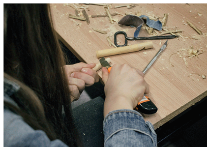
5. STRUGANIE CZOPA